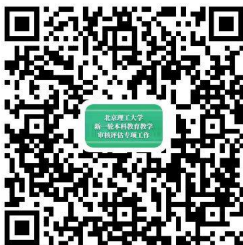
北京理工大学新一轮本科教育教学审核评估专项工作网页二维码

5. 持续进行过程数据和信息记录，发布线上评估工作要求及进展情况，为师生实时掌握迎评工作动态、全面了解与配合迎评工作做好各类服务保障工作。